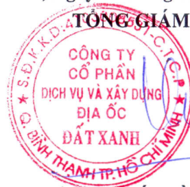
LƯƠNG TRÍ THÌN