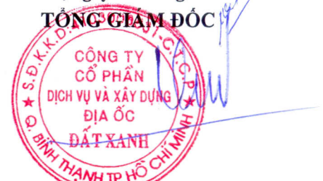
LƯƠNG TRÍ THÌN