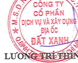
LƯƠNG TRÍ THẦN