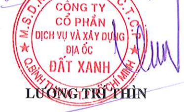
LUONG TRI THIN