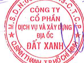
LƯƠNG TRI THÌN