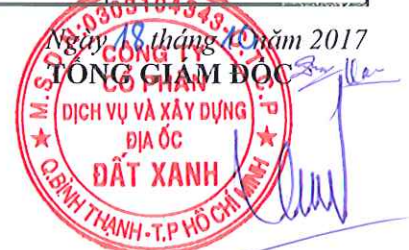
LƯƠNG TRÍ THÌN