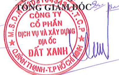
LƯƠNG TRÍ THÌN