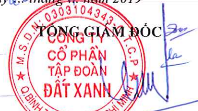
LUƠNG TRI THÌN