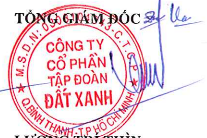
LƯƠNG TRI THÌN